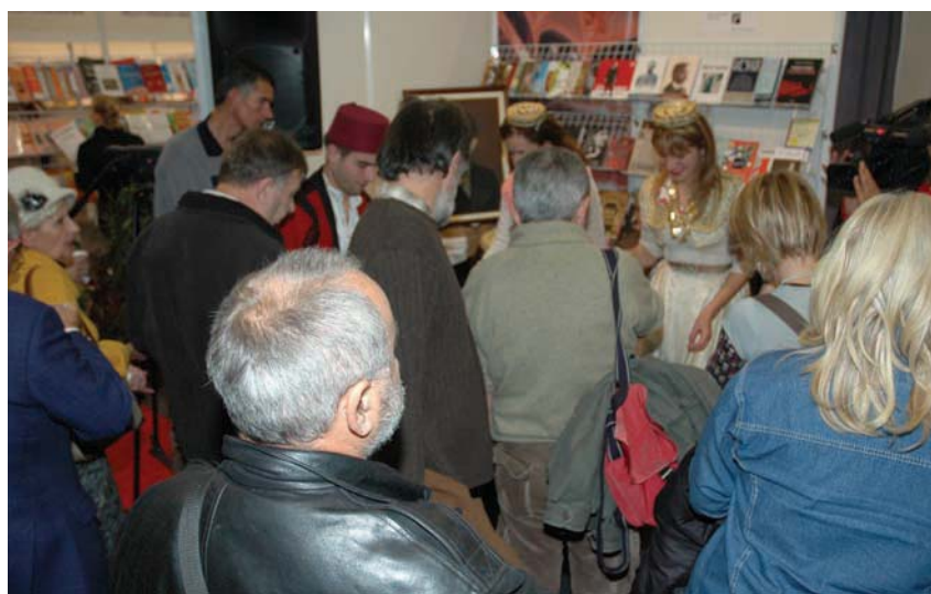
Degustacija baklave na štandu BNV na Beogradskom sajmu

Obraćajući se prisutnima na promociji, predsjednik Izvršnog odbora Bošnjačkog nacional-